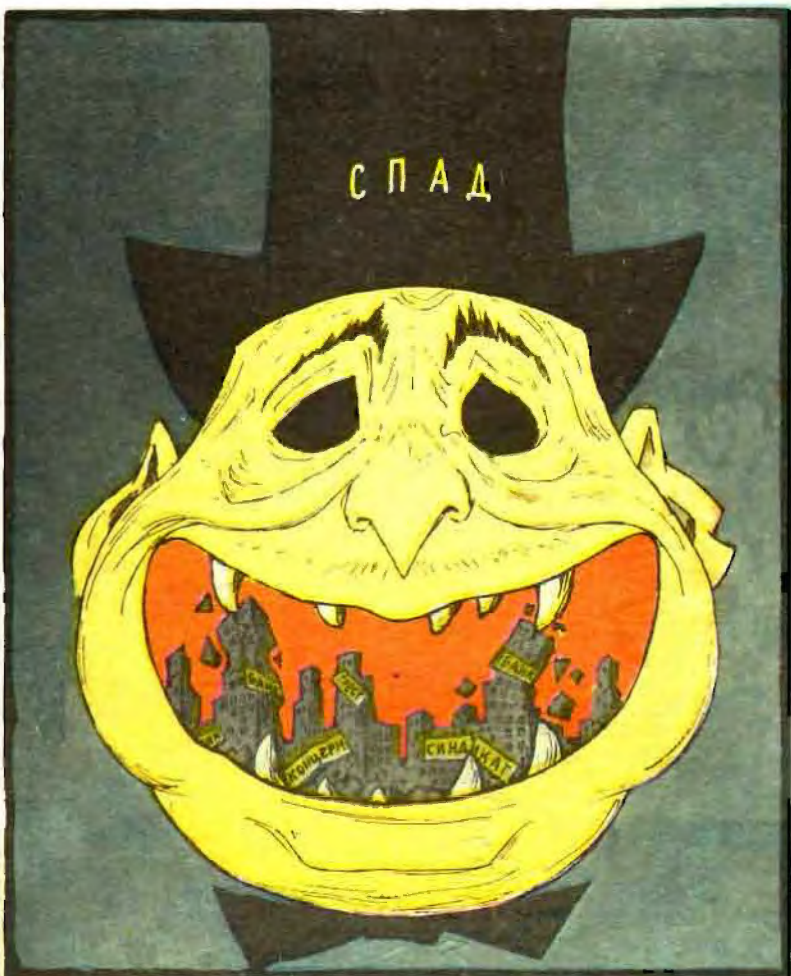
Рисунок М. АБРАМОВА