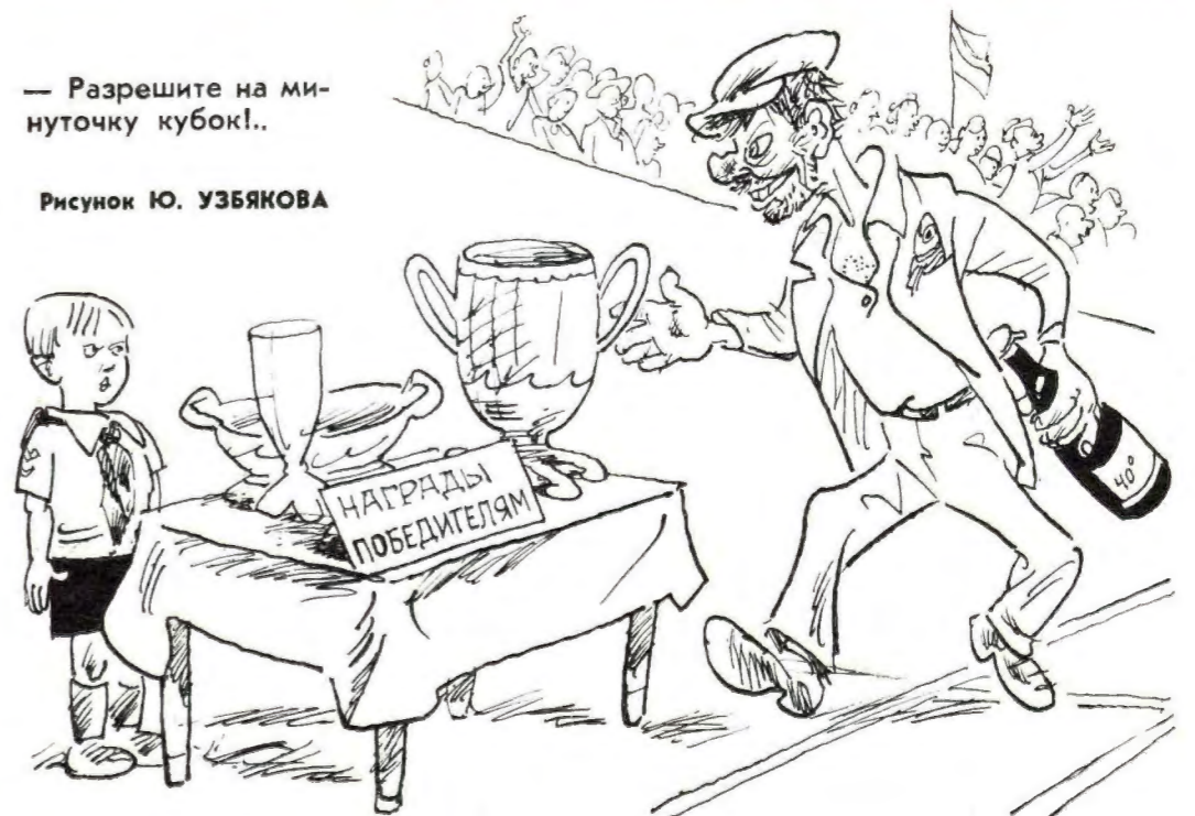
Рисунок Ю. УЗБЕКОВА