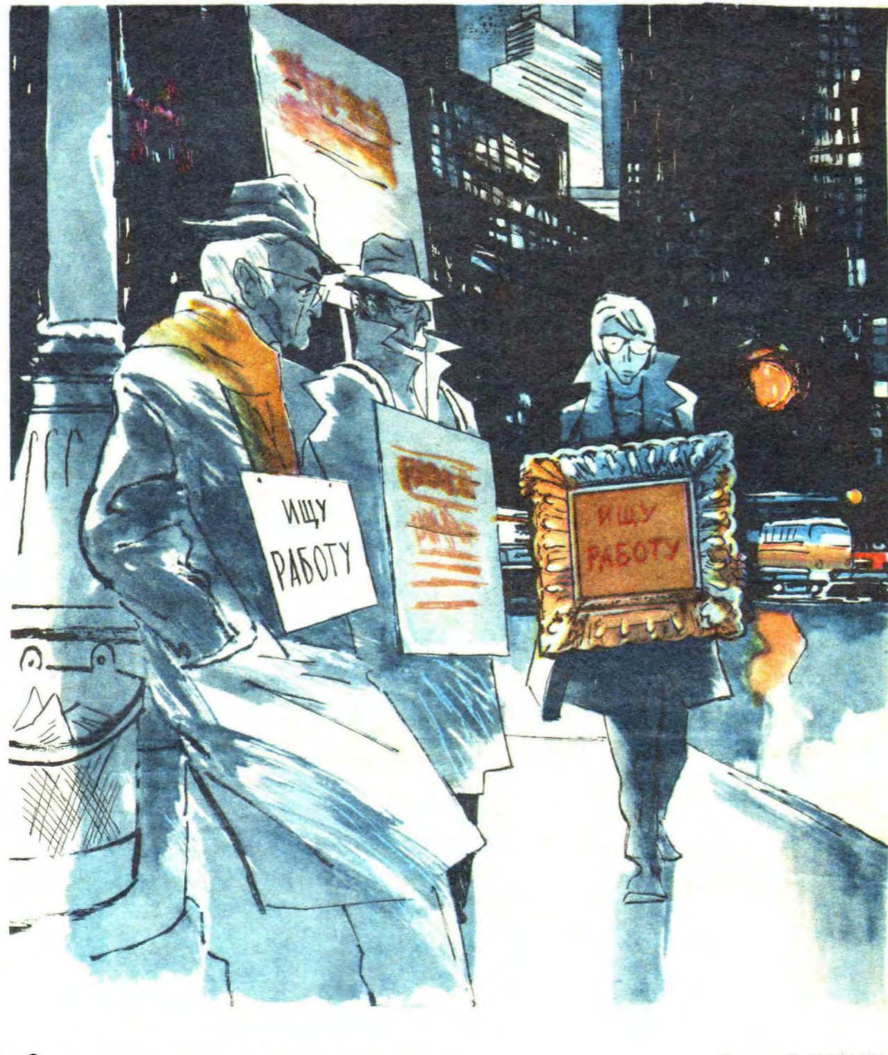
— Он только что окончил академию художеств...

— Щенок! Мальчишка! — рвал и метал дед. — С тобой еще гуманно поступили, бросили на тротуар! Надо было бросить за решетку! Прежде чем решаться на такой шаг, надо было посоветоваться со мной! Разве ты не читал в газетах, что за последние полгода на семьдесят процентов увеличилось число жуликов, пытающихся получить деньги по фальшивым чекам? Развее не помнишь, что президенты банков «Банк Америкарда» и «Мастер Чардж» пообещали безжалостно ловить этих жуликов?